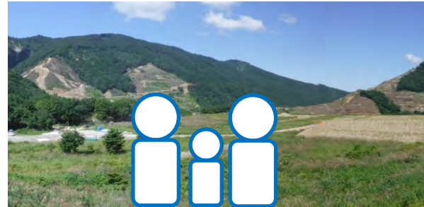
複数人の場合：集合写真