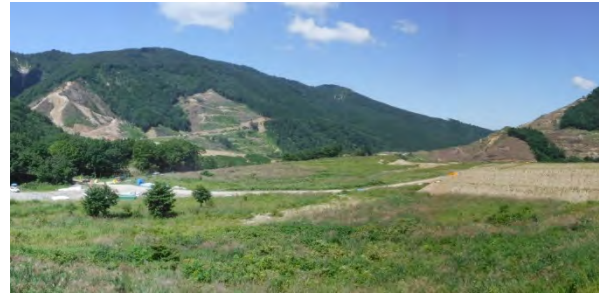
一人の場合：風景写真